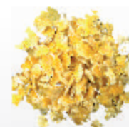
Vialac Torneio contém milho flocculado

Alimento Premium indicado para compor a dieta das vacas em lactação de alta produção, destinadas a torneio leiteiro. A formulação com matérias primas nobres visa proporcionar melhor aporte protéico e energético, maximizando a produção de leite.